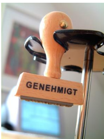
Abbildungen: Beispieldefinition einer Aktion im Status „Entwurf“ (Urlaubsantrag)